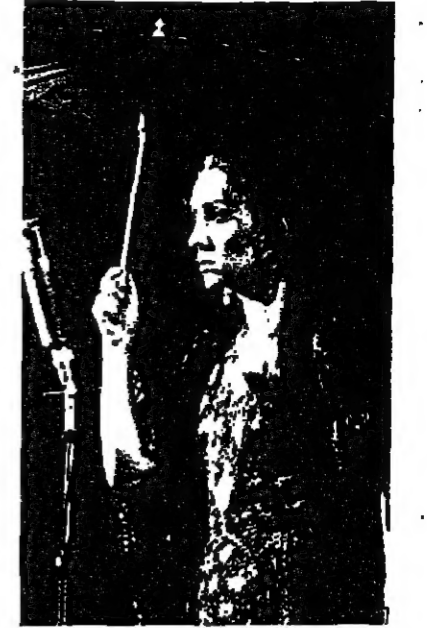
فيروز تغني للبنان أم للعالم؟

اما اختيار المسرح الغنائي من حيث المبدأ فكان بالإضافة الى ما يقتضيه تجارياً، يساهم في تكريس صورة الإبداع التي تخدم طابقي فيروز - لبنان - فهي فترة كان المسرح الغنائي - الهجري - ملاءمته على طريبي الصينين الثاني والثالث يعكس فيروز التي بدأ اسمها منذ تلك الفترة يمارس هيئته الفنية ويطلق اسم نمرى شمس الدين كإبراز الأمثلة على مطرب تحول الى «مشترك مع» فيروز